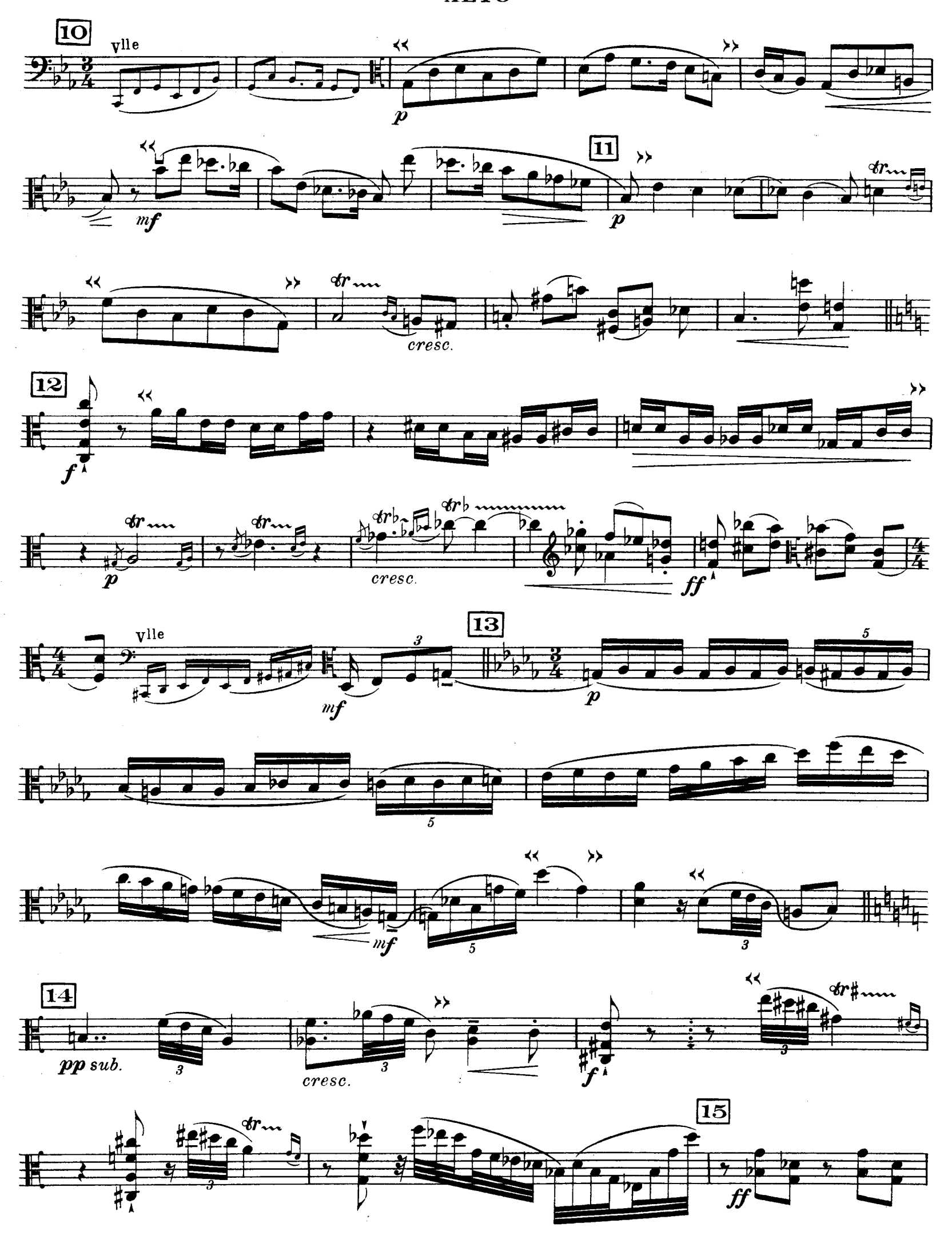
D. & F. 13,244 bis