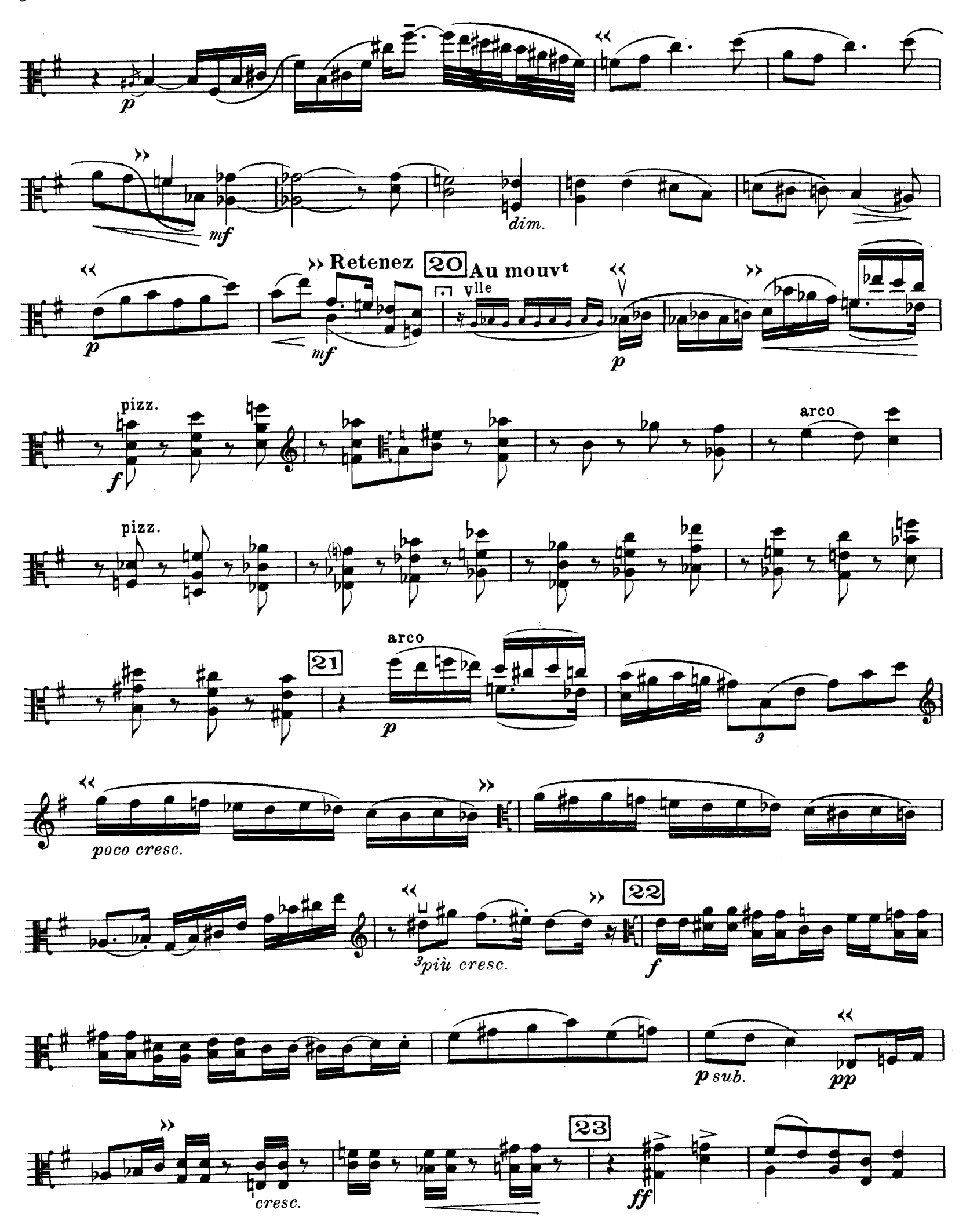
D. & F. 13,244 bis