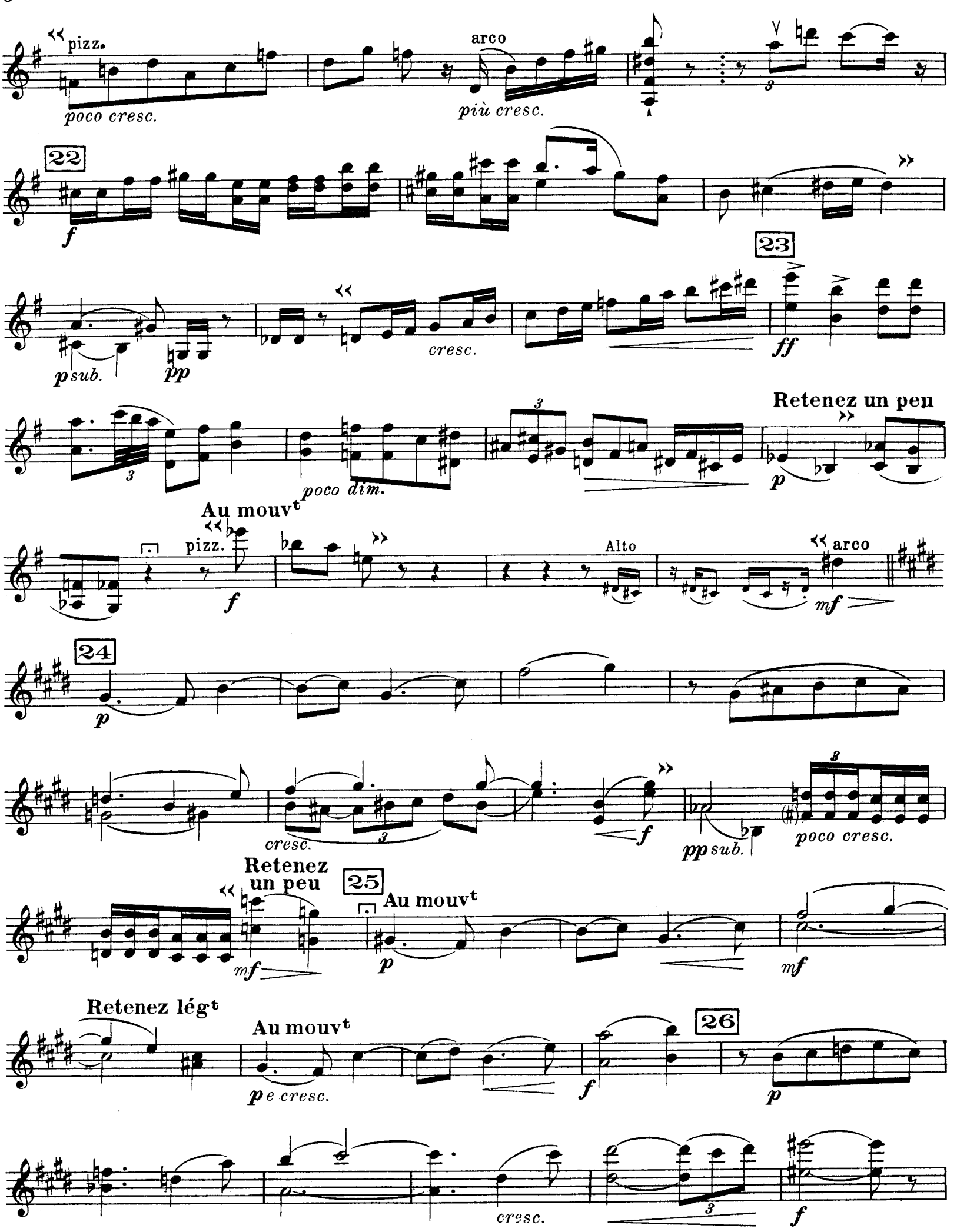
D. & F. 13,244 lis