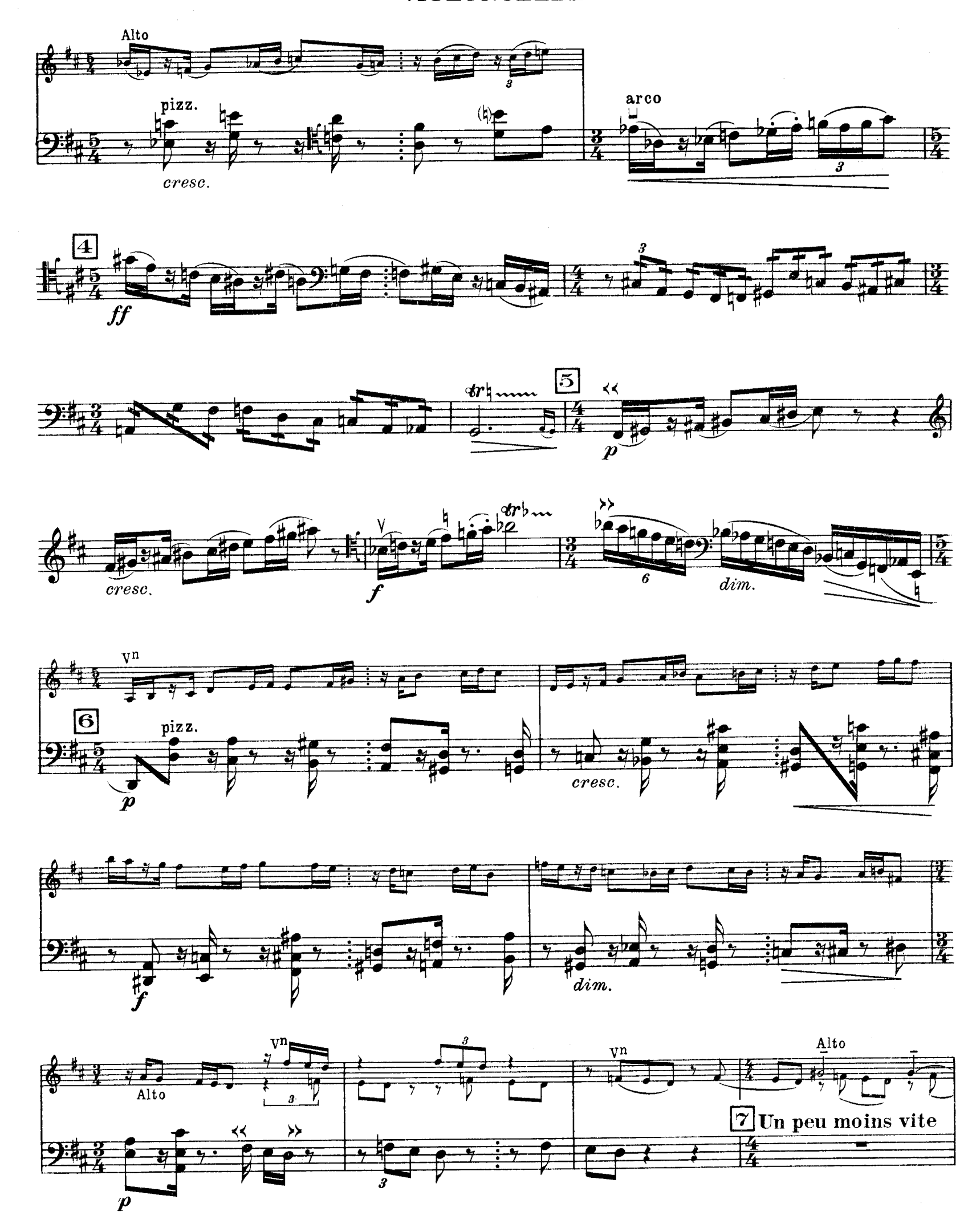
D. & F. 13,244 bis