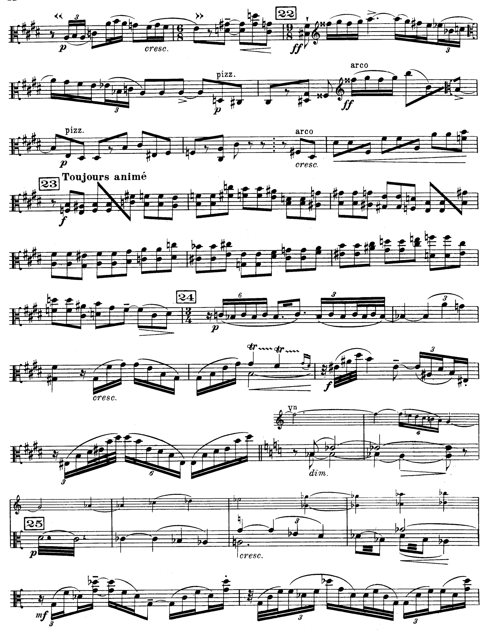
D. & F. 13,244 bis