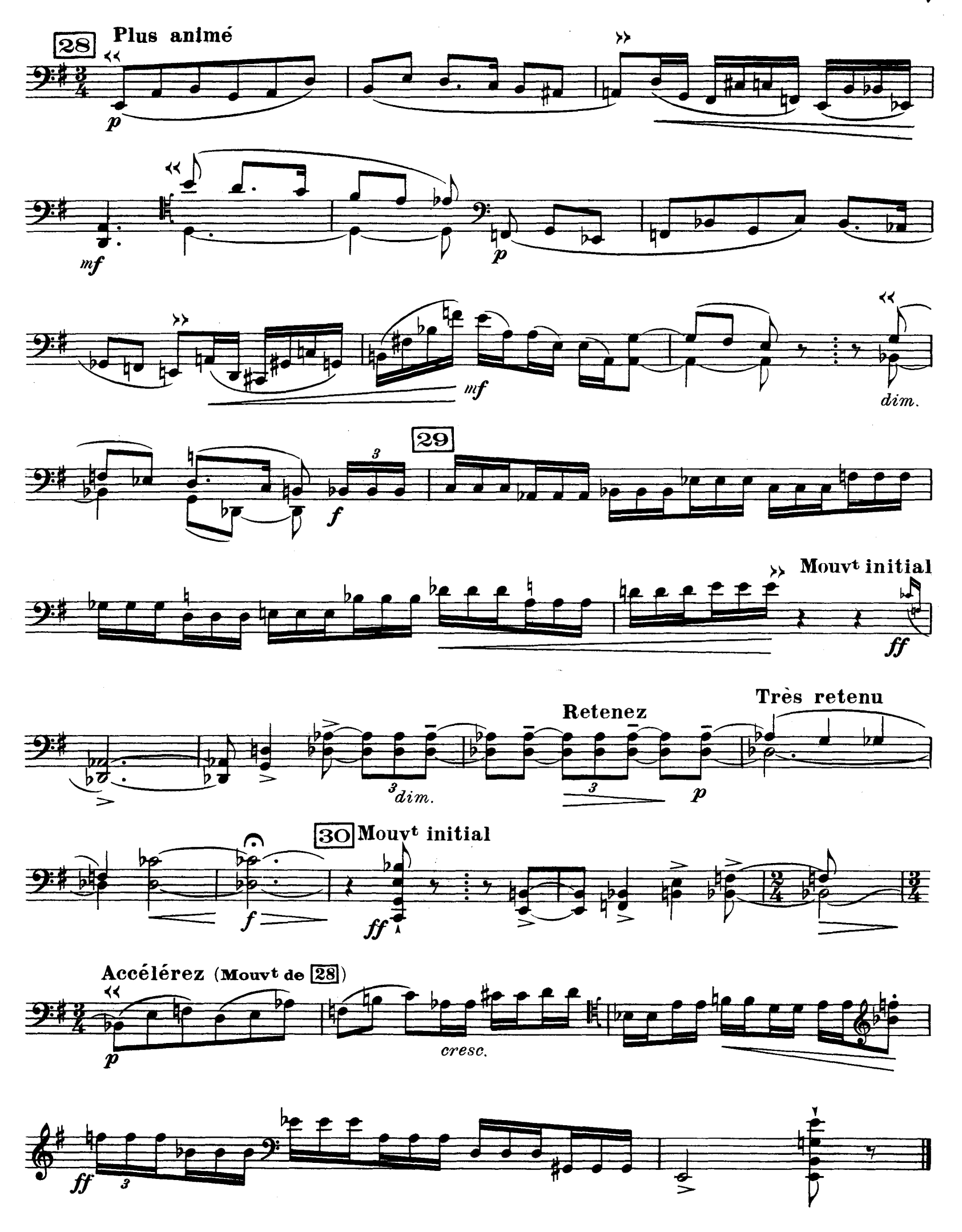
D. & F. 13,244 bis