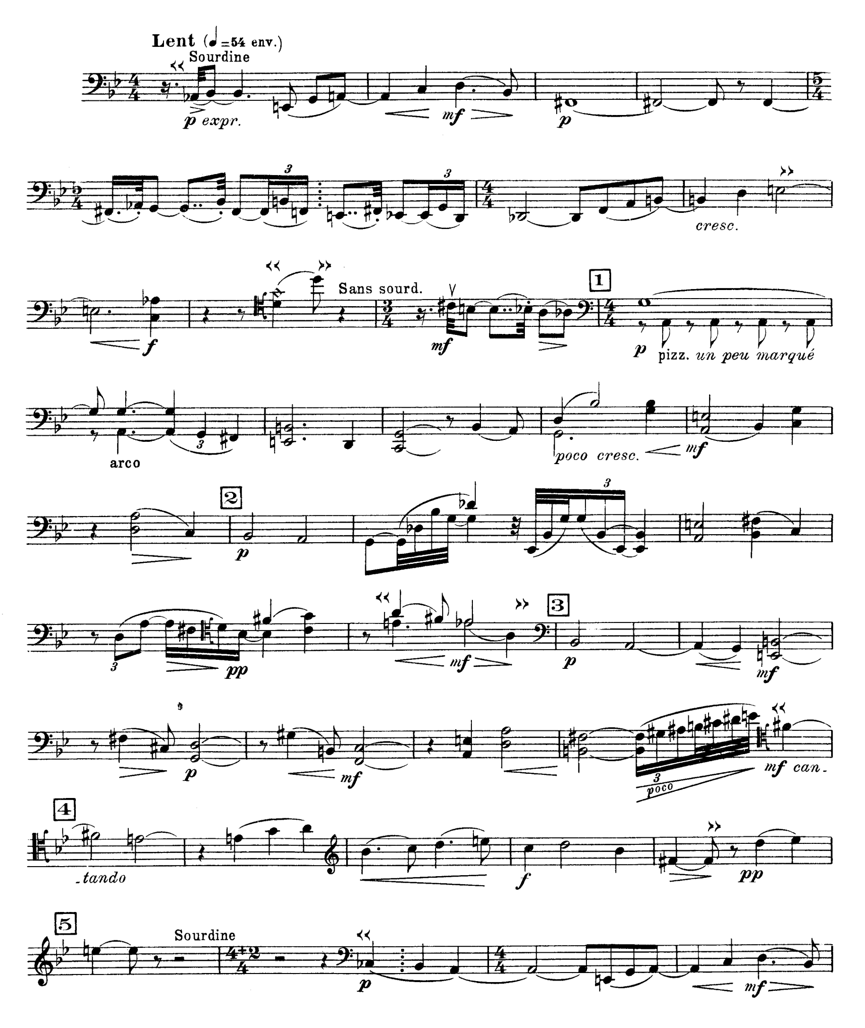
D. & F. 13,244 bis