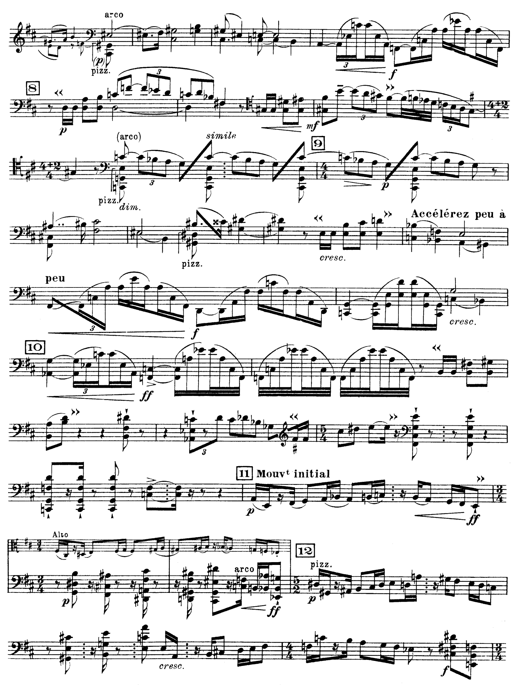
D. & F. 13,244 bis