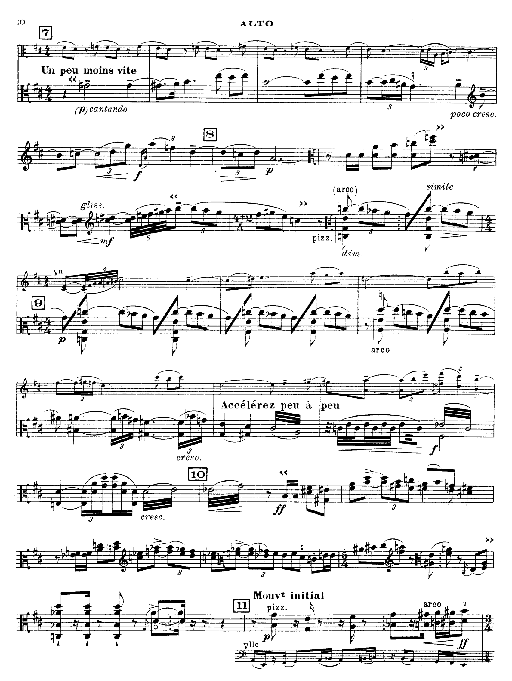
D. & F. 13,244 bis