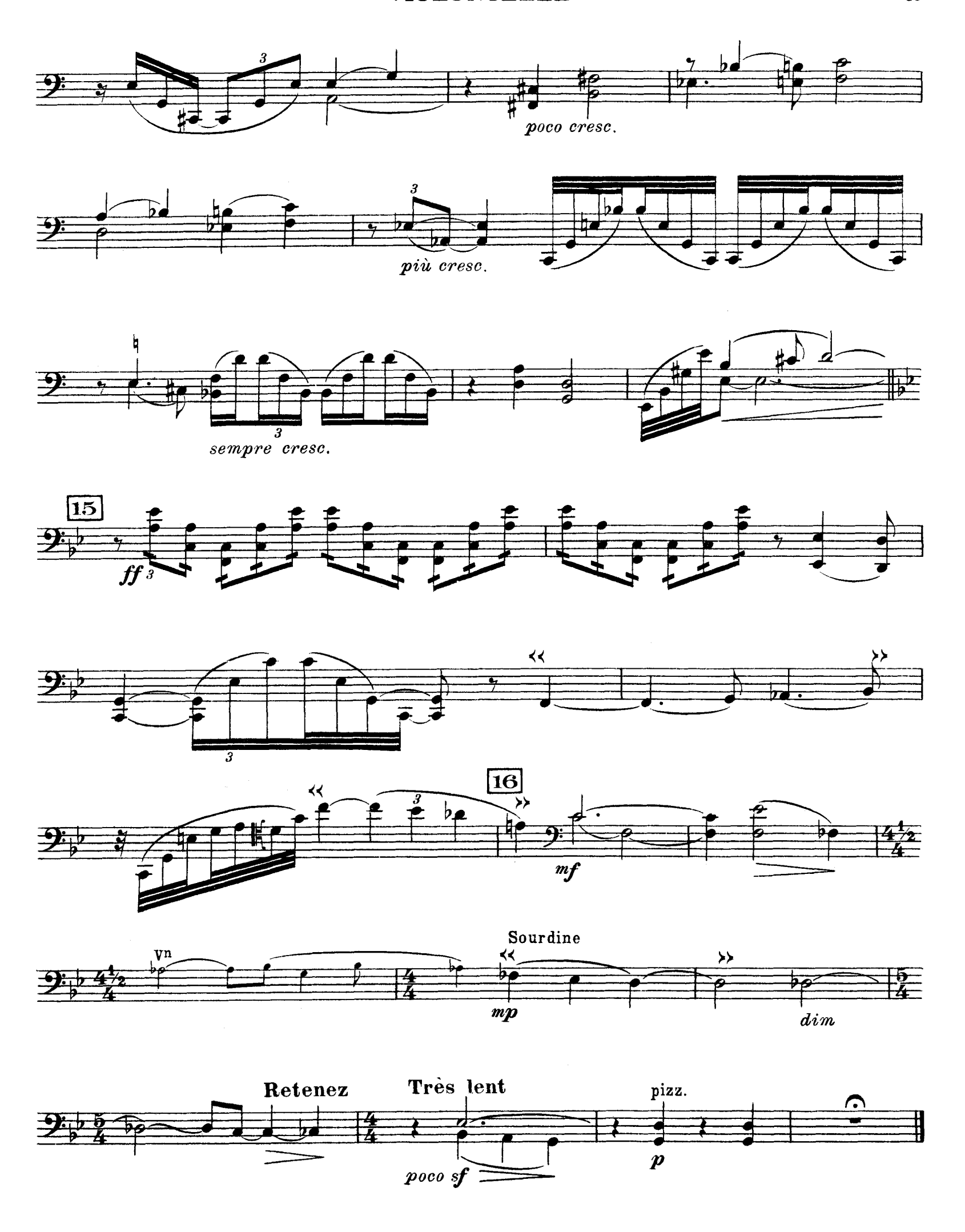
D. & F. 13,244 bis