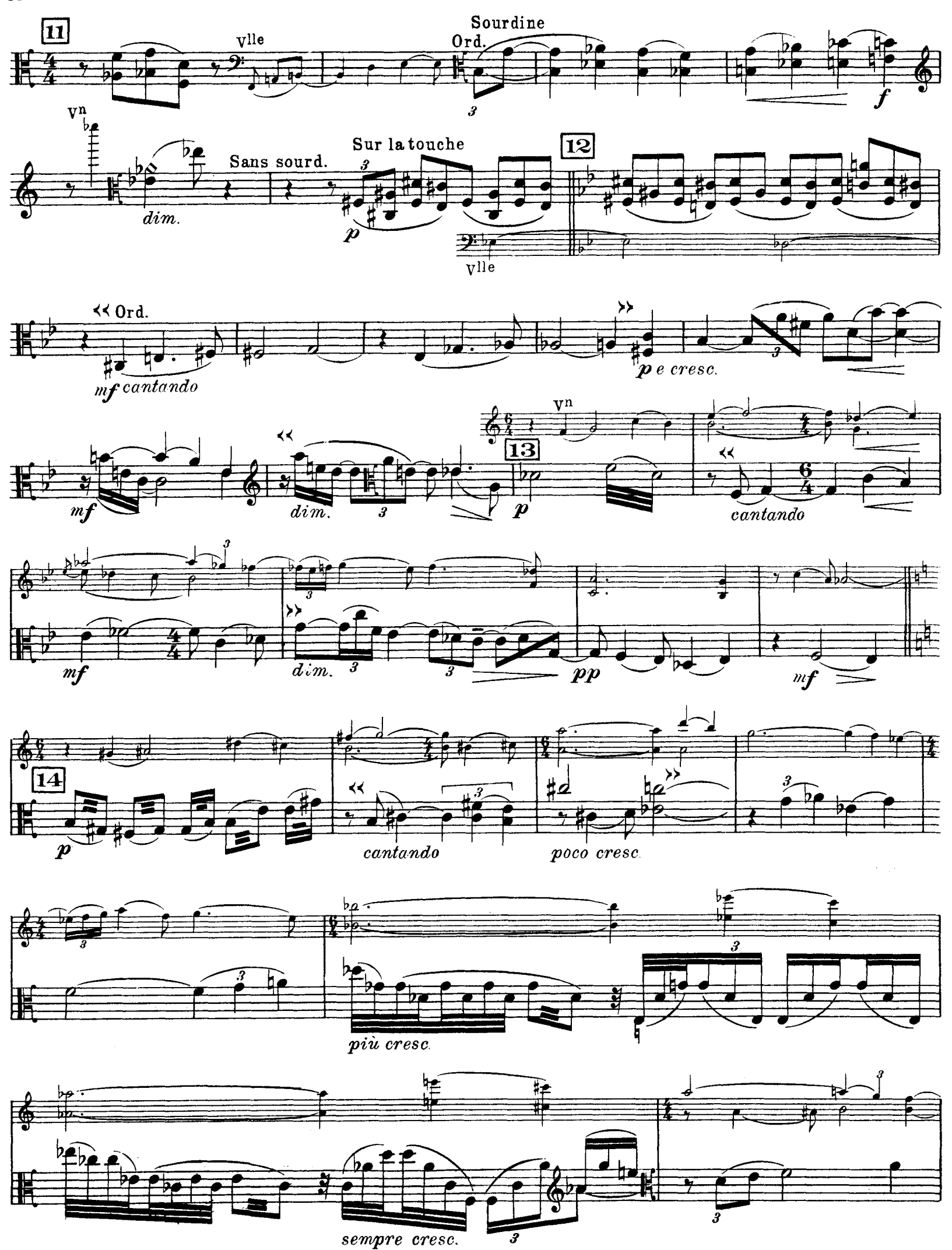
D. & F. 13,244 bis