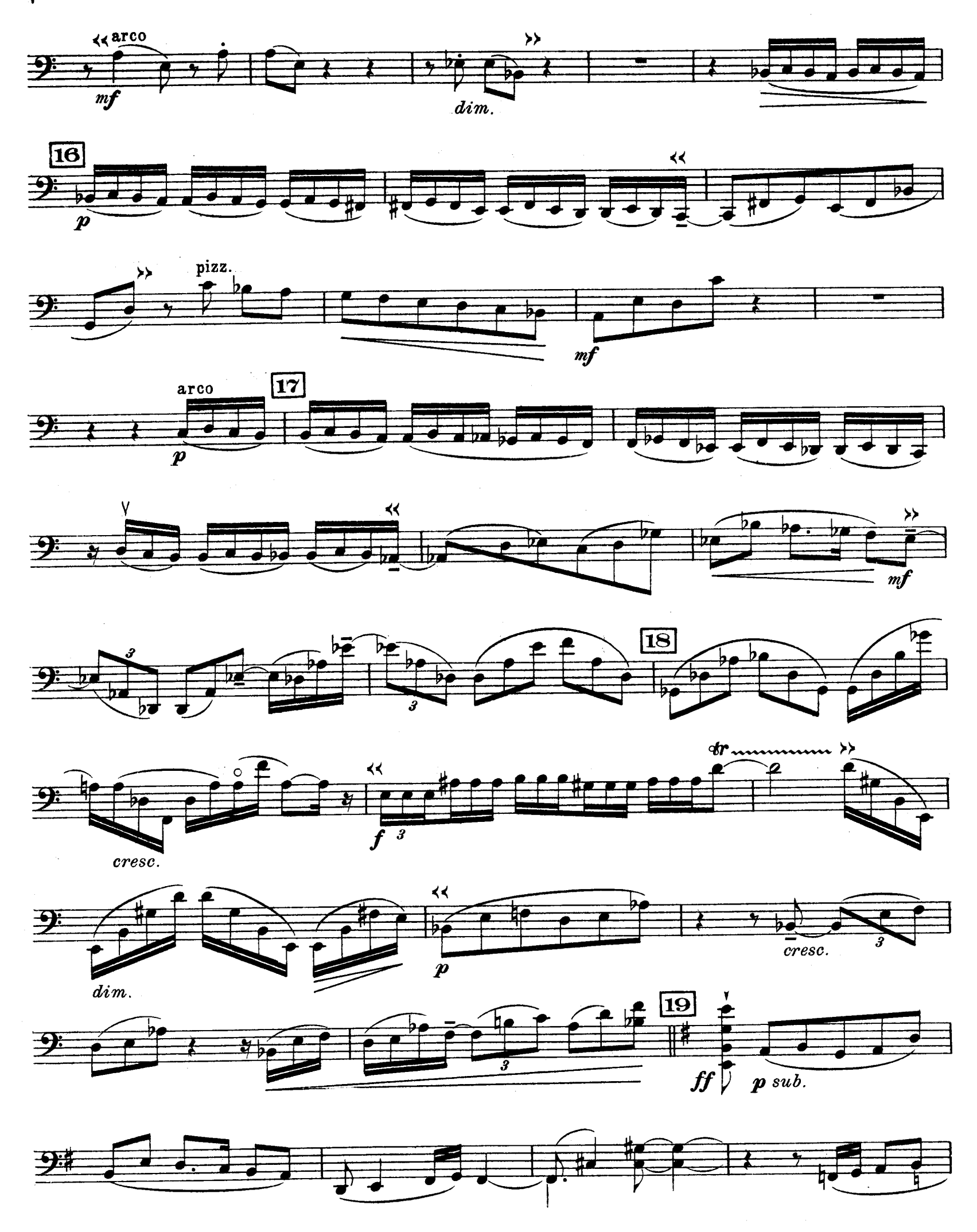
D.& F. 13,244 bis