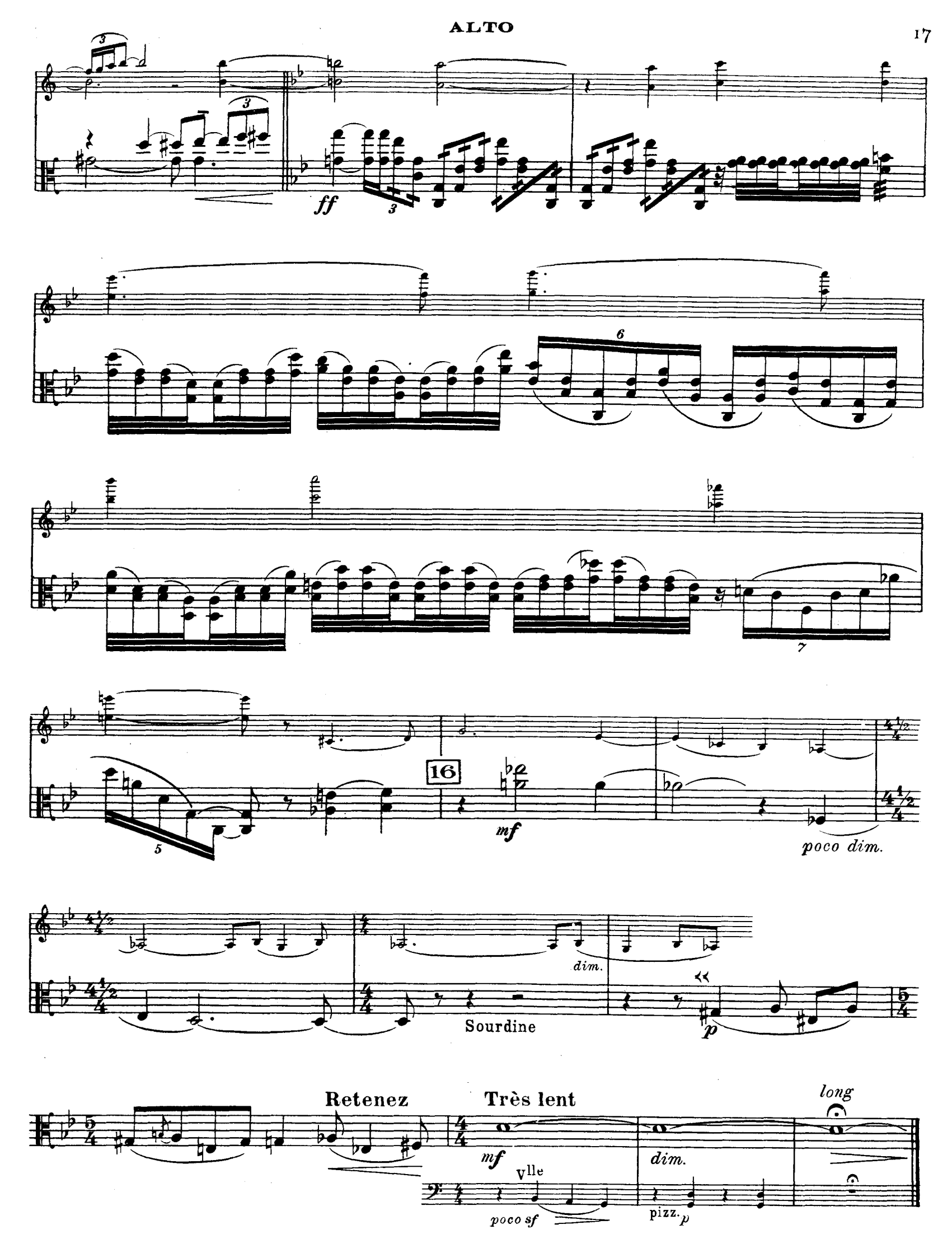
D. & F. 13,244 bis