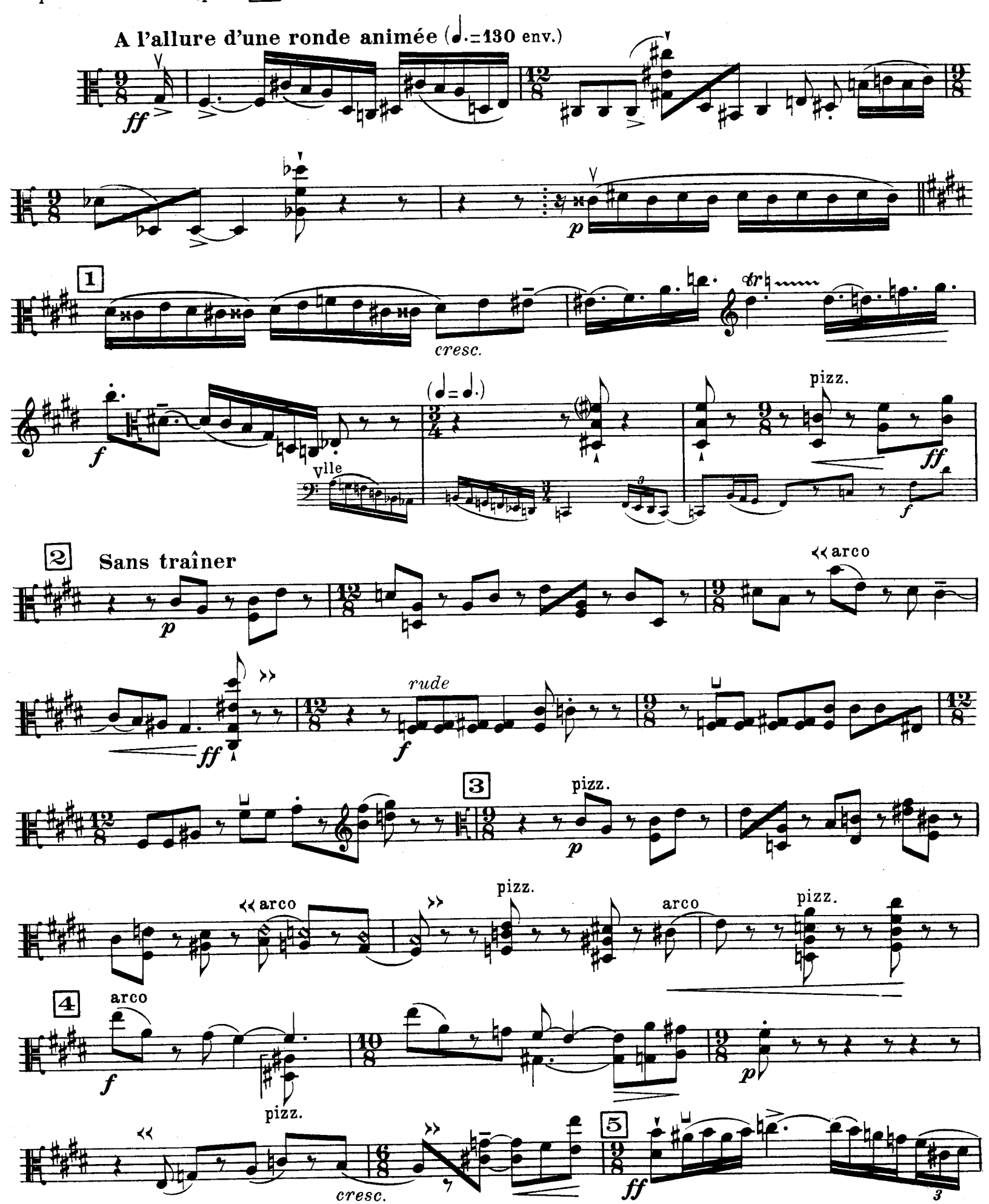
D. & F. 13,244 bis