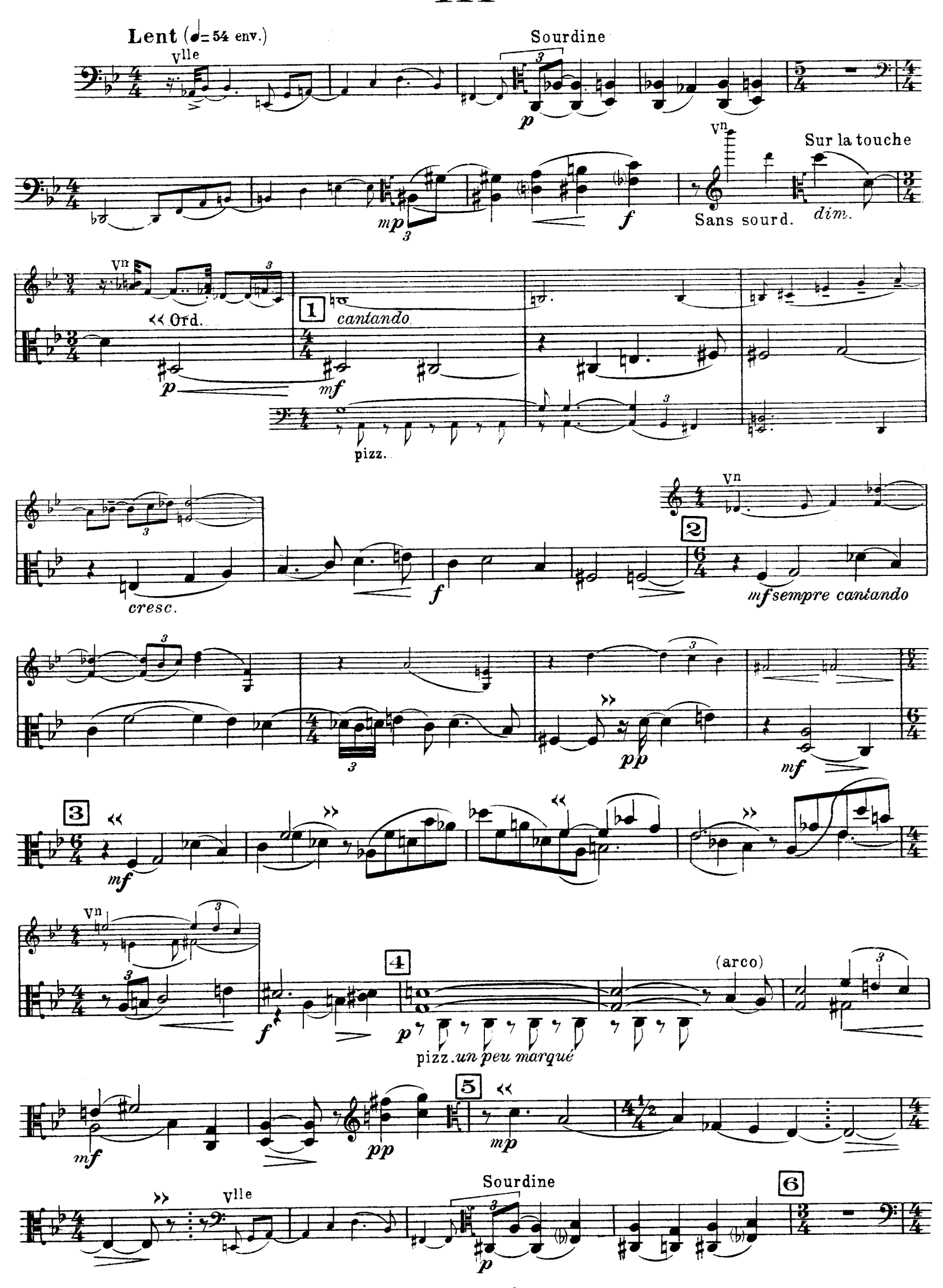
D. & F. 13,244 bis