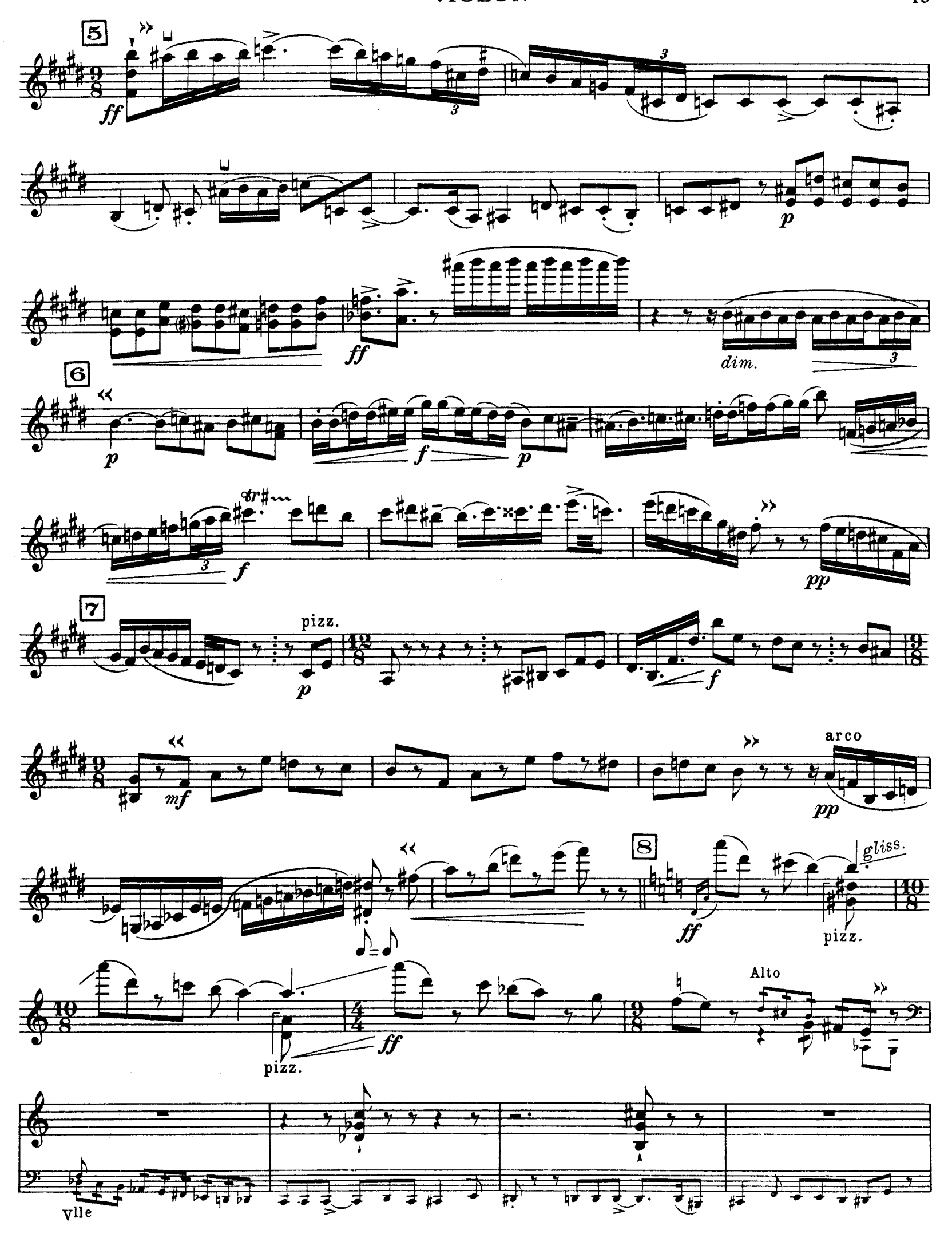
D. & F. 13,244 bis