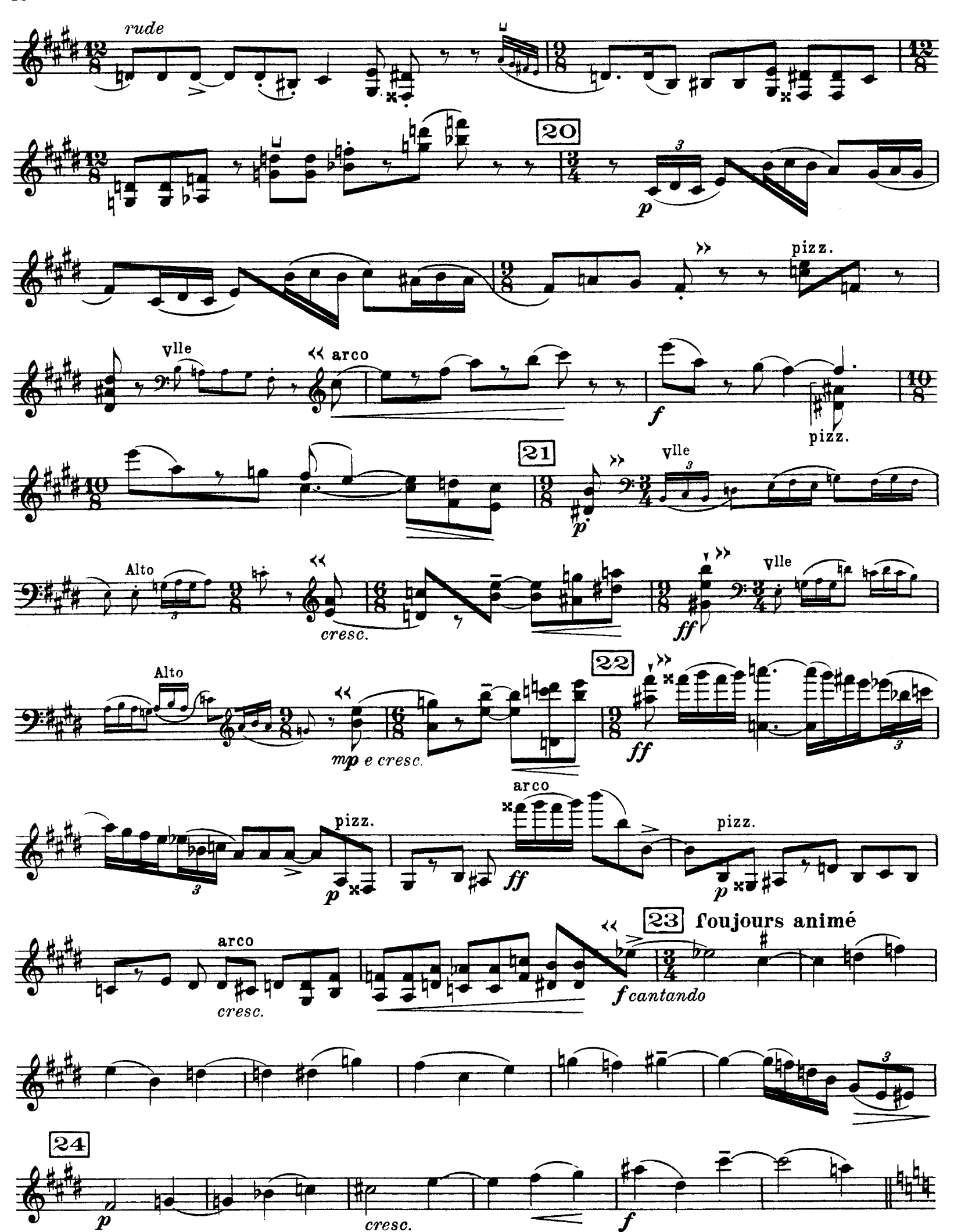
D.& F. 13,244 bis