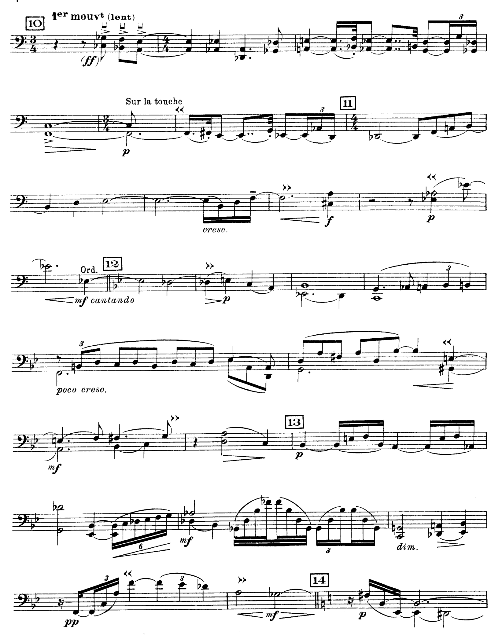
D. & F. 13,244bis