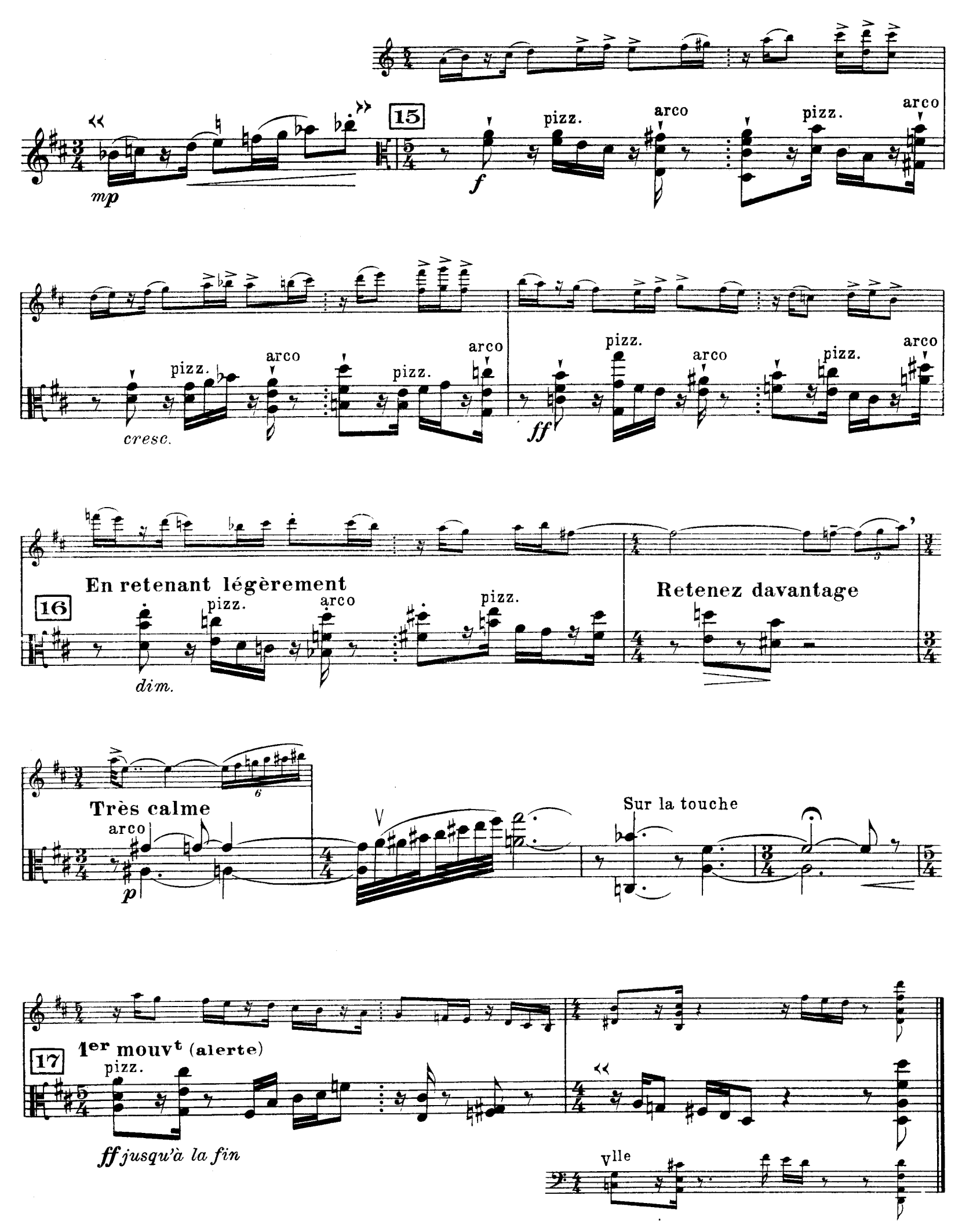
D. & F. 13, 244 bis