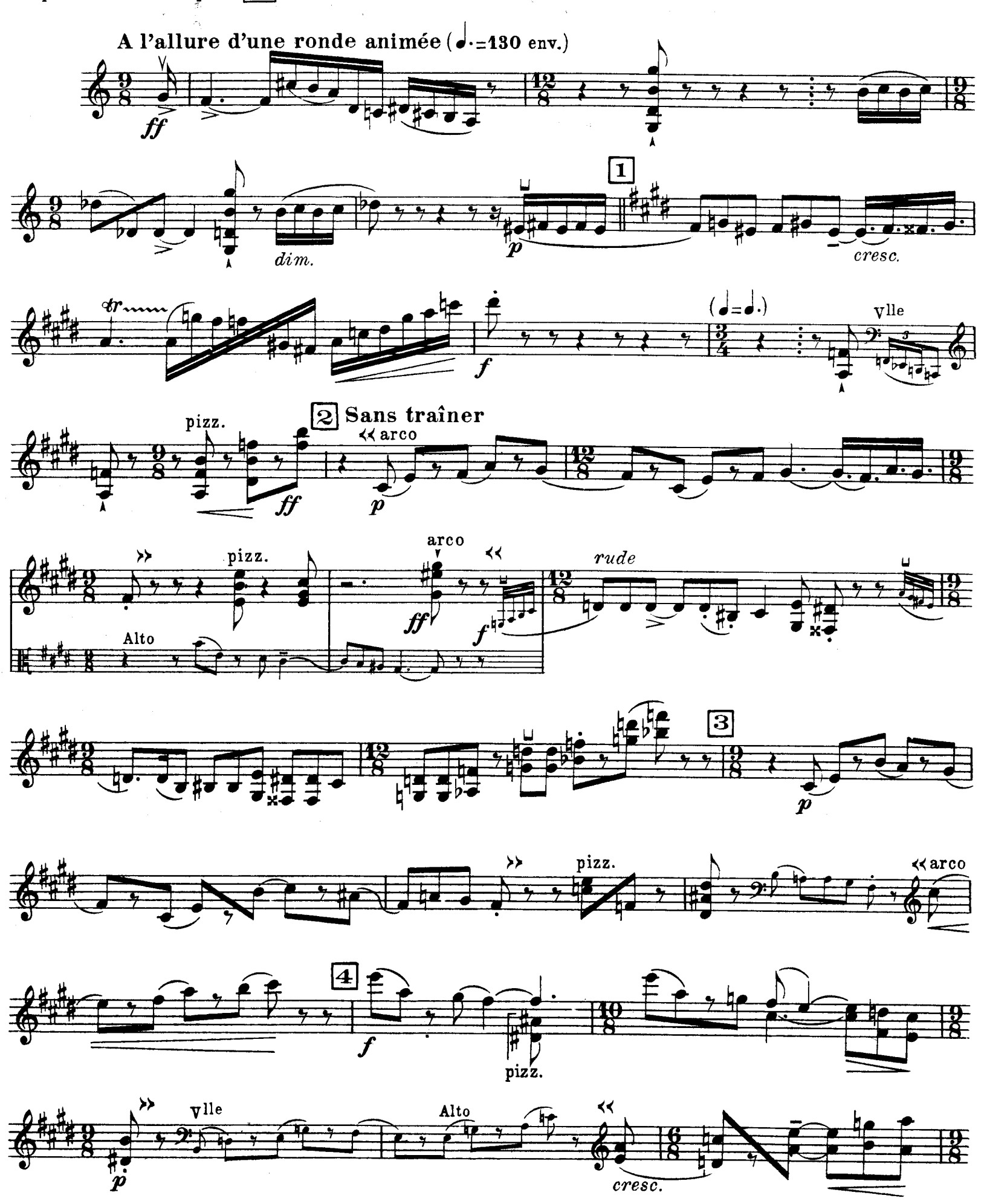
D. & F. 13,244 bis