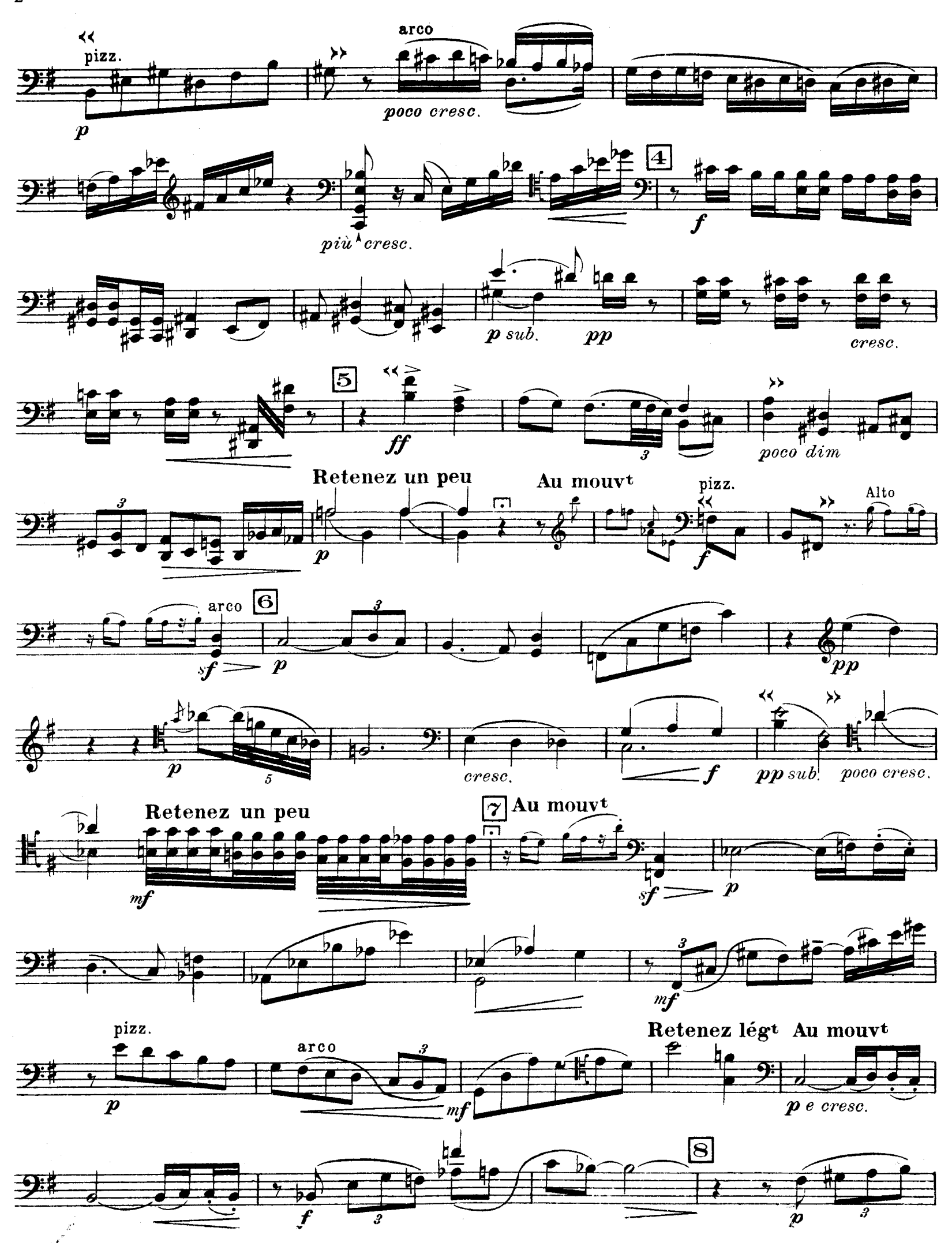
D. &F 13.244bis