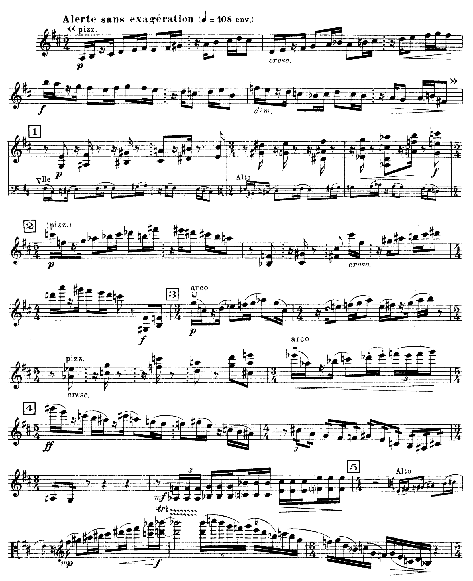
D. & F. 13,244 bis