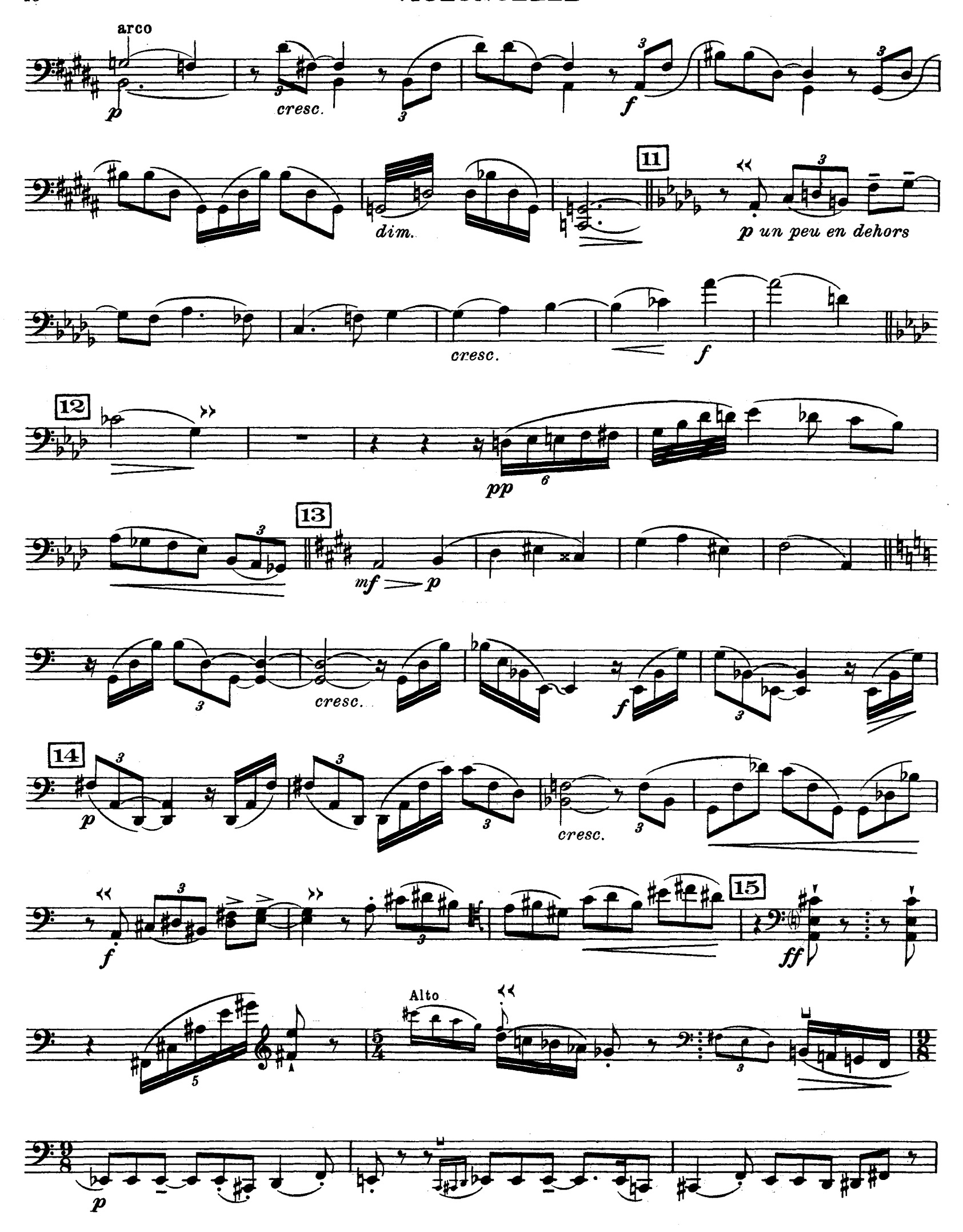
D.& F. 13,244 bis